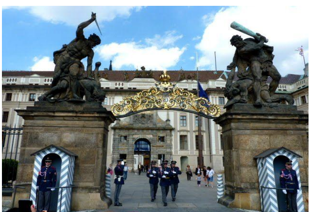
Cambio de guardia