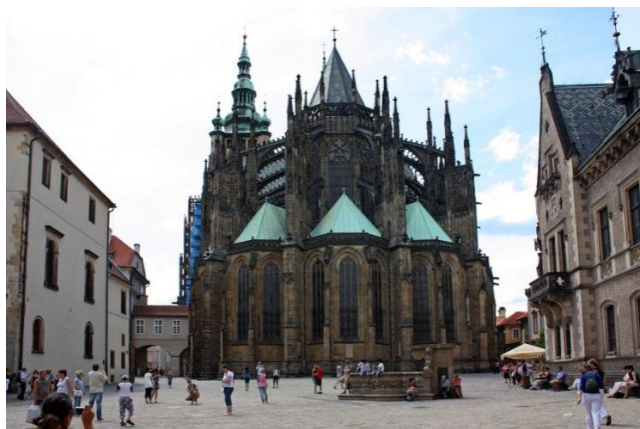
Catedral de San Vito

Hay una visita imprescindible en la capital checa, es la del Castillo de Praga. Conocido en su idioma original como Pražský hrad , este castillo está considerado la mayor fortaleza en su estilo del mundo, y es el mejor testigo del pasado histórico de la ciudad como centro administrativo, cultural y religioso de la región de Bohemia.