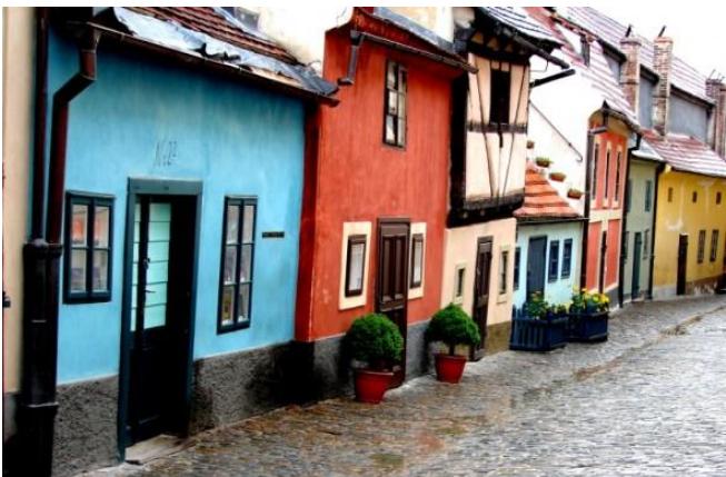
Callejón del oro

(El precio incluye ticket de tranvía al Castillo.)